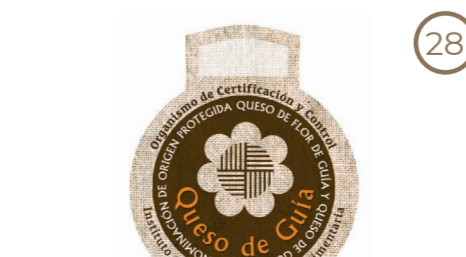
Queso de Flor de Guía Queso de Media Flor de Guía Queso de Guía CANARIAS (DOP)