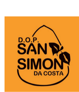
San Simón da Costa GALICIA (DOP)