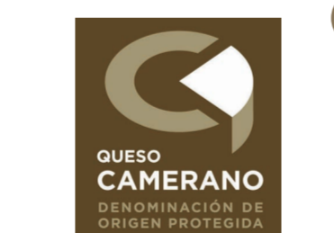
Queso Camerano LA RIOJA (DOP)