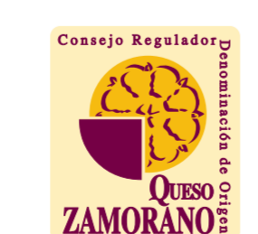
Queso Zamorano CASTILLA Y LEÓN (DOP)