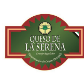
Queso de La Serena EXTREMADURA (DOP)