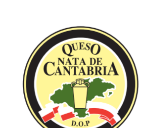
Queso Nata de Cantabria CANTABRIA (DOP)