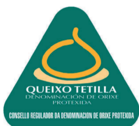
Queso Tetilla GALICIA (DOP)