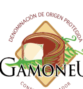
Queso Gamonedo ASTURIAS (DOP)