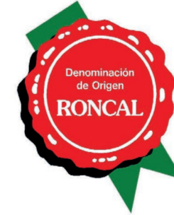
Roncal NAVARRA (DOP)