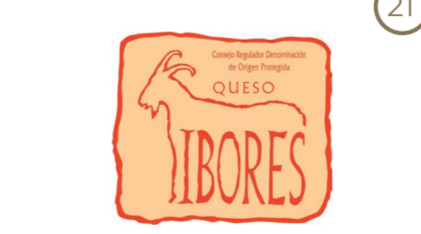
Queso Ibores EXTREMADURA (DOP)