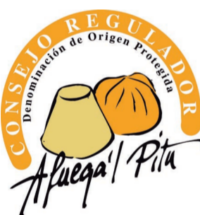
Afuega'l Pitu ASTURIAS (DOP)