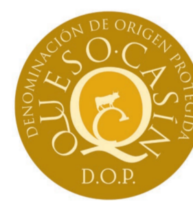
Queso Casín ASTURIAS (DOP)